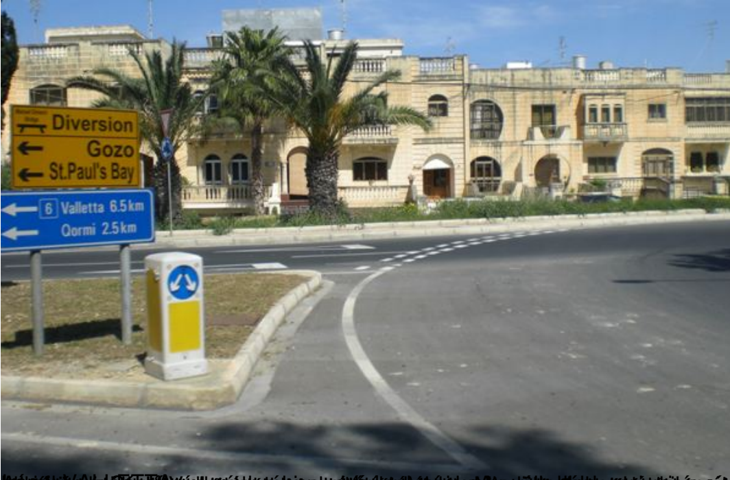
És a kora délutáni közlekedés