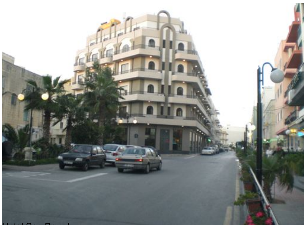
Hotel San Pawl